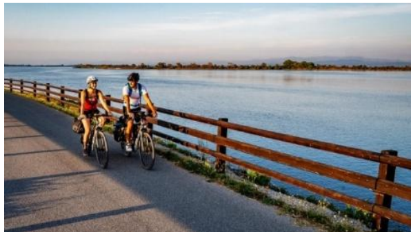
Slika 1

Če želite izvedeti več o projektu ADRIONCYCLETOUR