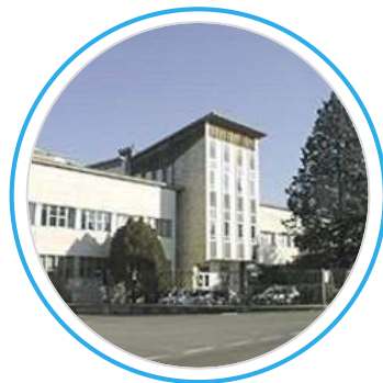
ISIS MALIGNANI 2000 Cervignano del Friuli