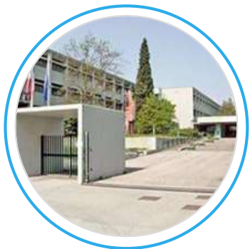
ITIS "J.F. Kennedy" Pordenone