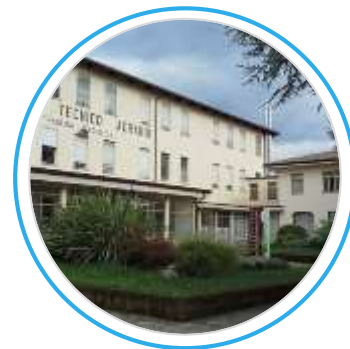
ITA PAOLINO D'AQUILEIA Cividale del Friuli