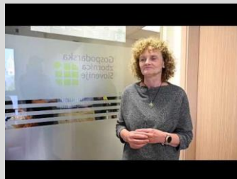
Delavnica Nova Gorica, 24. 10. 2019

Delavnica je bila namenjena izmenjavi izkušenj in obstoječih praks, ki odpirajo možnosti za boljšo izrabo odpadkov na osnovi polimernih kompozitov, utrjenih s steklenimi vlakni, ki jih ponuja čezmejno sodelovanje med Slovenijo in Italijo. Delavnice se je udeležilo okoli 50 predstavnikov podjetij, tako iz zasebnega kot javnega sektorja, javnih institucij in drugih zainteresiranih javnosti za tovrstno tematiko iz Slovenije in Italije.