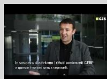
Primer dobre prakse: JP Voka Snaga d.o.o.