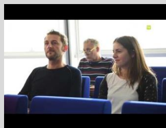
Delavnica IT, 9. 11. 2018 (na voljo v italijanščini)