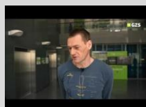
Kako prepoznamo stekloplastične izdelke