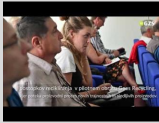
Delavnica IT, 11. 7. 2019